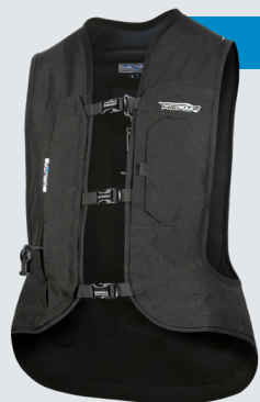
TURTLE 2 černá 560€/14 560Kč*

Velikosti XS -> XL-L Naše airbagová vesta integruje TURTLE technologii: airbag se nachází pod zádovým protektorem (SAS-TEC level 2). Tato inovace je pro ochranu zad velkým zlepšením.