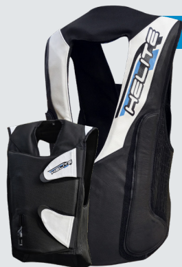
GP AIR 2 740€/19 240Kč

Velikosti S -> XL-L Airbagová vesta testována piloty pro piloty! Pozornost byla soustředěna na aerodynamiku, perfektní padnutí a prostor pro zádový hrb. Pro vyšší bezpečnost je airbag vyroben z oděru vzdorných materiálů a v přední a zadní části jsou implementovány protektory, což vytváří již známý TURTLE efekt!