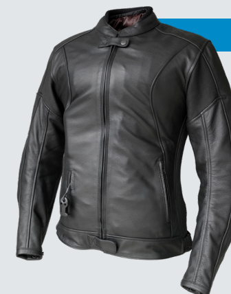
XENA 849€/21 990Kč

Velikosti S -> 6XL Černá nebo hnědá barva. Integrovaná Turtle technologie. Velmi pěkný střih, který nikdy nevyjde z módy! Pouze vy budete vědět, že máte na sobě tu nejlepší ochranu.