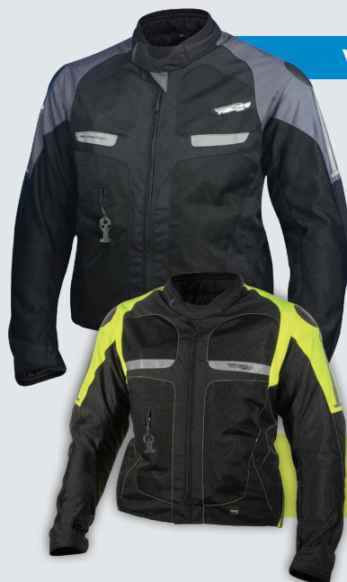
VENTED 689€/17 910Kč

Velikosti S -> 4XL Pokud je příliš horko a bezpečnost je nejvýše na seznamu, naše Vented bunda je ta nejlepší volba. Pěkný síťovaný design integruje TURTLE technologii.