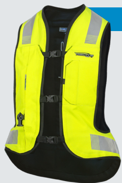
TURTLE 2 Hi-Vis 609€/15 830Kč*

Velikosti XS -> XL-L Hi-Vis airbagová vesta s nejvyšším stupněm ochrany řidiče je kombinace nehodové prevence i ochrany. S Turtle technologií je výsledek absorpce a rozptýlení nárazů znatelně vyšší.