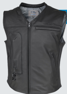
CUSTOM 689€/ 17 910Kč

Velikosti S -> XL-L Airbagová vesta testována piloty pro piloty! Pozornost byla soustředěna na aerodynamiku, perfektní padnutí a prostor pro zádový hrb. Pro vyšší bezpečnost je airbag vyroben z oděru vzdorných materiálů a v přední a zadní části jsou implementovány protektory, což vytváří již známý TURTLE efekt!