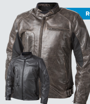
ROADSTER 849€/21 990Kč

Velikosti S -> 6XL Šedá nebo černá barva. Velmi pěkná bunda. Perfektní pro jízdu na dlouhé vzdálenosti. Touring je airbagová celoroční bunda, vodě a větru odolná, prodyšná membrána do jakéhokoliv počasí.