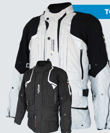
TOURING 749€/19 470Kč

Velikosti S -> 6XL Šedá nebo černá barva. Velmi pěkná bunda. Perfektní pro jízdu na dlouhé vzdálenosti. Touring je airbagová celoroční bunda, vodě a větru odolná, prodyšná membrána do jakéhokoliv počasí.